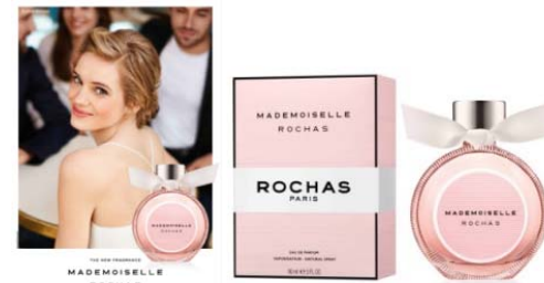
Mars Mademoiselle Rochas Eau de parfum