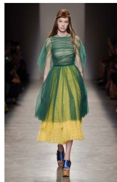
Collection printemps/été 2017 Défilé Rochas