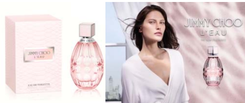
Janvier Jimmy Choo L'Eau