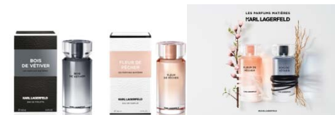
Août Les Parfums Matières Eau de Toilette / Eau de Parfum