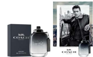
Septembre Coach Man Eau de toilette