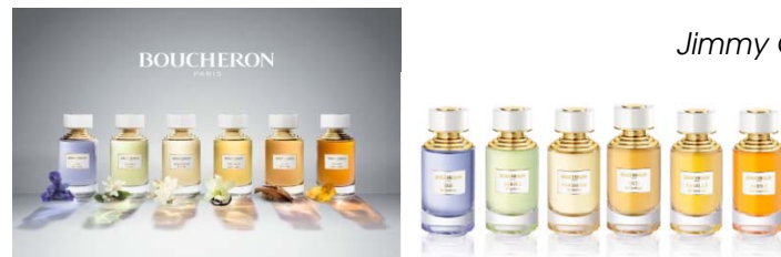
Mars La collection Boucheron