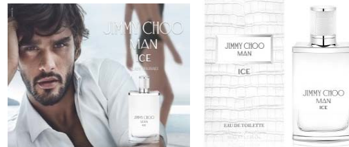
Février Jimmy Choo Man Ice