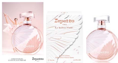
Janvier Repetto Le ballet blanc Eau de toilette