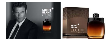
Juillet Montblanc Legend Night