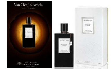
Avril Collection Extraordinaire Bois Doré Van Cleef & Arpels