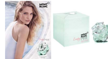
Mars Montblanc Lady Emblem L'Eau